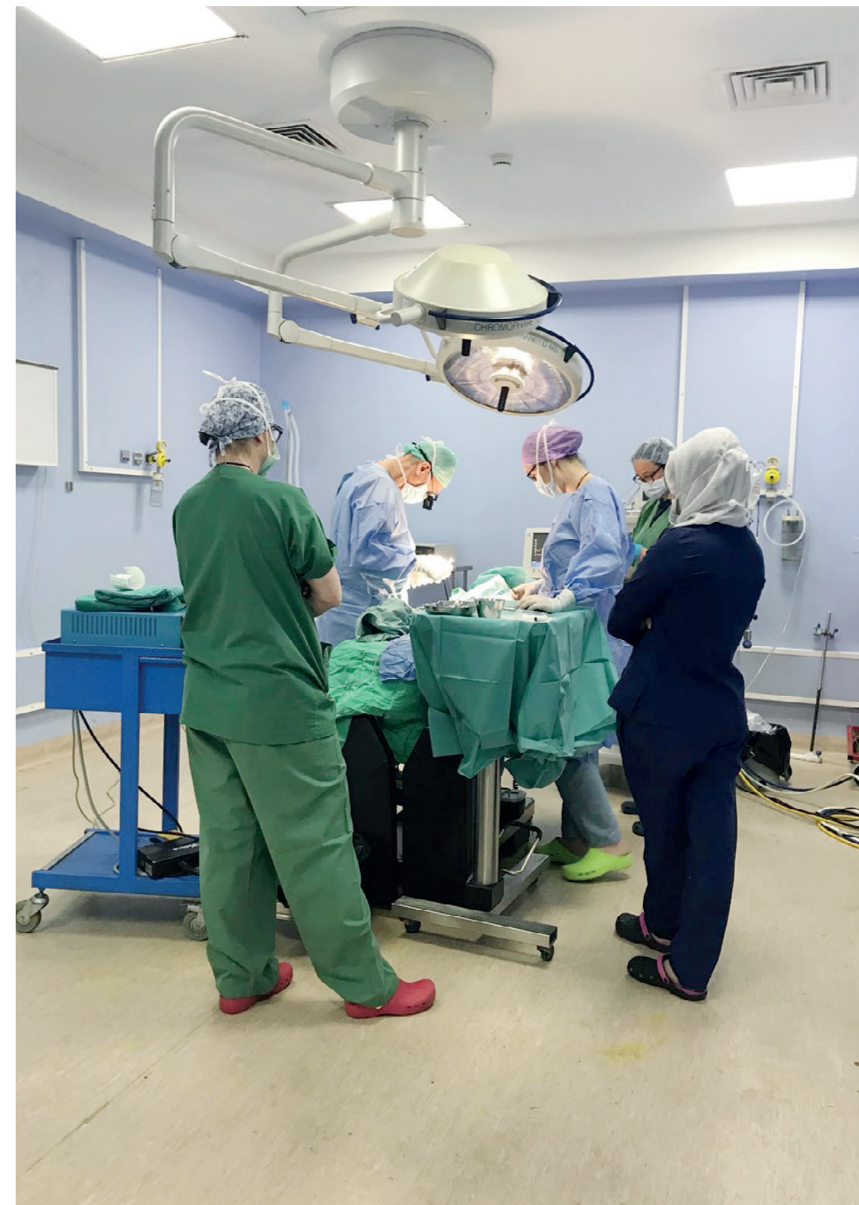
Während einer der über 60 Operationen in Burkina Faso, Léo. Der Operationsaal ist mit allem Notwendigen ausgestattet.