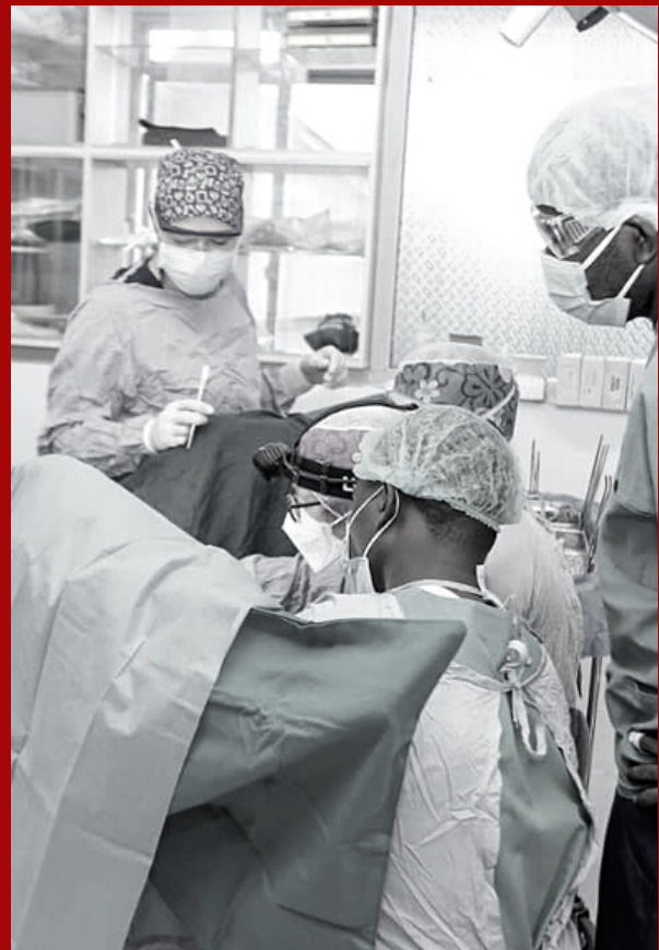
Gynäkologischer Eingriff in Uganda im Teaching Modus